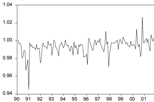
Gráfico 2.1: Razón del IPC : IPC(-1) / IPC