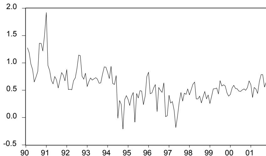
Gráfico 1: Variación porcentual mensual del tipo de cambio (1990 - 2001)