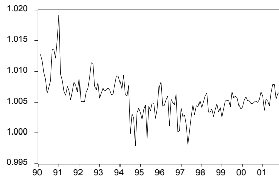
Gráfico 2.2: Razón del tipo de cambio: TC / TC(-1)